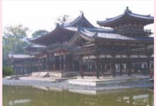
관람 시간 : 8:30-17:30 (박물관은 17:00까지), 관람료 600엔 Ujirenge, Uji 전화 : 0774-21-2861

또 경내에는 보우또우인의 귀중한 소장품이나 불교가 일본에 전해져 내려온 유래나 변천사 등에 관하여 알기 쉽게 설명되어 있는 박물관(보우또우인 박물관 호우소우관)이 있고 귀중한 불상과 영상을 가까이에서 볼 수 있거나 여기서 밖에 살수 없는 오리지널 신발을 구입할 수도 있다.