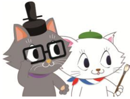
市会マスコットキャラクター またきち・マタリーヌ