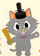
市会マスコット キャラクター またきち