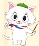
市会マスコット キャラクター マタリヌ