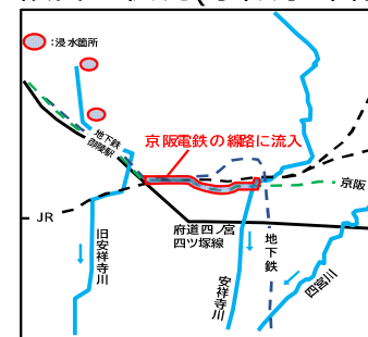
浸水被害発生箇所(R3)