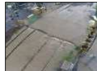
浸水被害の状況(京阪京津線)(R3)