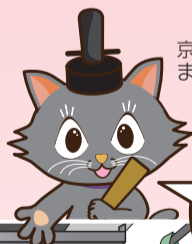
京都市会マスコットキャラクター またきち

京都市会誕生130周年の節目を記念し、よりインパクトがあり、より伝わるデザインをとおして多くの方に京都市会の取組を知っていただくため、ポスターのデザインを募集します。