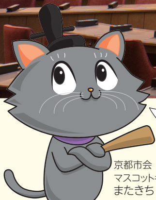
京都市会 マスコットキャラクター またぎち

議会棟を含む市庁舎は耐震性能の不足や防災機能の向上など、早急に対応しなくてはならない多くの課題を抱えていたんだ。歴史ある議場を保存・活用しつつ、しっかりと議論する環境を整備したんだよ。