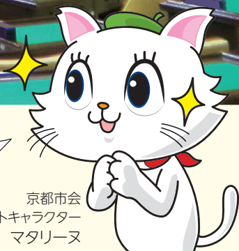
京都市会 マスコットキャラクター マタリーヌ

これから始まる9月市会では、主に令和2年度の決算について議論するね。京都市の厳しい財政状況に対する市会の取組を4面で紹介するわ。