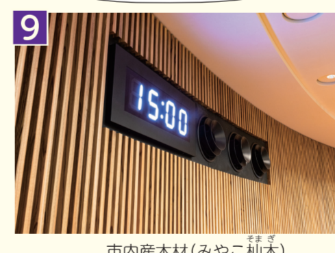
市内産木材(みやこ榎木)

二元代表制の一翼を担う京都市会は、新しくなった議場で、これからも市民の代表として暮らしをより良くするために、しっかりと議論を重ねていきます。