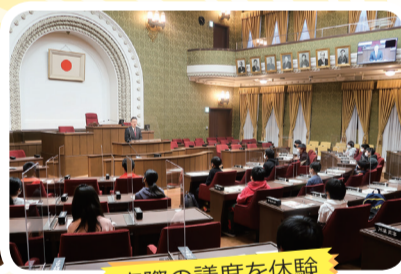
実際の議席を体験