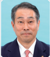
西村 義直 議員 (自民/西京区)