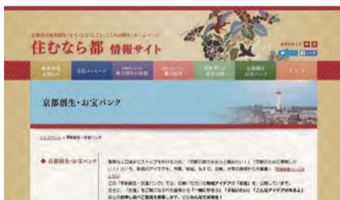
「京都創生・お宝バンク」(「住むなら都 情報サイト」ホームページ)

人口減少問題に取り組むために市民の皆様から提案を募集する「京都創生・お宝バンク」の取組を、人口減少対策に限らず、まちづくり全般に広げ、様々な課題を「ひとごと」でなく市民と市が共に「自分ごと」「みんなごと」として捉え、協働する新たな事業。