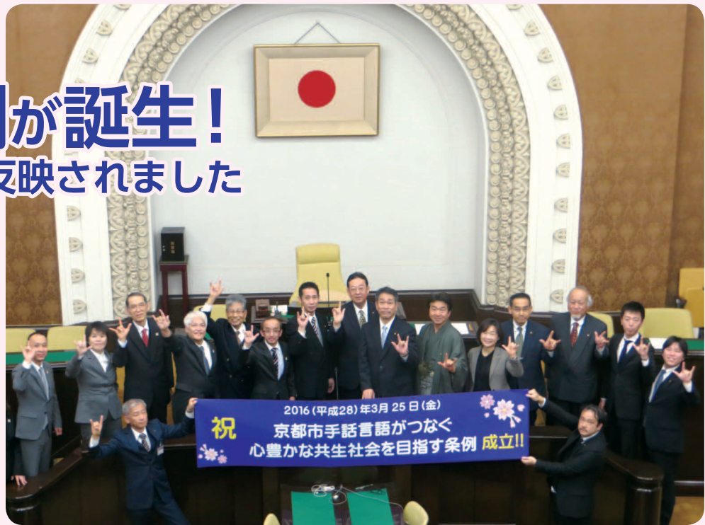
▲正副議長、プロジェクトチームと京都市聴覚障害者協会の方々との集合写真

条例制定に当たっては、全会派の代表によるプロジェクトチームを設置して取り組むとともに、市民の皆様からの御意見も募集。手話による意見提出も含め、1,706件にものぼる御意見を頂きました。