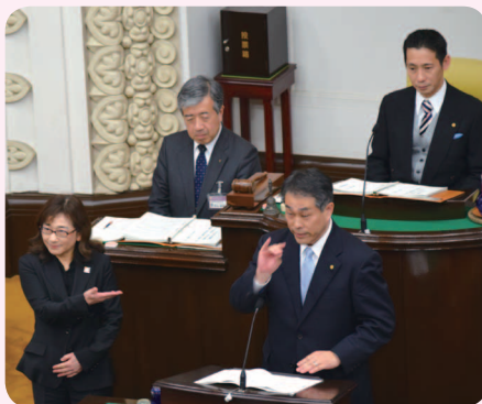
▲手話による提案説明の様子