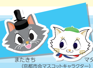
またきち マタリーヌ (京都市会マスコットキャラクター)