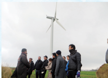
サムソ島における風車の視察の様子

10月31日から11月8日までの9日間、「省エネルギーや再生可能エネルギーによる持続可能な地域社会の実現」をテーマとして、議員11名による調査団が海外行政調査を実施しました。今回は、「2050年までに100%再生可能エネルギーによりエネルギー需要をまかなう」という先進的な目標を掲げているデンマークの取組を調査しました。調査で得られた成果等については、今後市会ホームページなどで、改めて報告します。