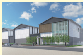
第二市場の新施設イメージ図