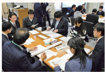
▲グループ別議論の様子

今後も引き続き、若い世代に京都市会を身近に感じ、政治参加への意識を高めてもらえるよう、市会としてできる取組を検討していきます!