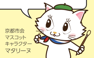
京都市会 マスコット キャラクター マタリヌ