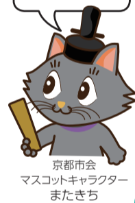
京都市会 マスコットキャラクター またきち

「決算」を認定(不認定)することは「予算」を決めることと並んで、市会にとっても大事な仕事だよ!