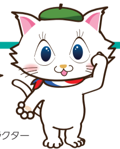
京都市会 マスコットキャラクター マタリーヌ

条例ができた後も、状況をしっかり確認、検証して、引き続き議論していくよ! 宿泊者の皆さんにも、京都の奥深い魅力を感じて欲しいね!