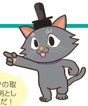
京都市会 マスコットキャラクター またきち