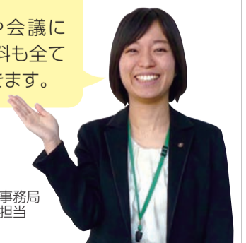
市会事務局 議事担当

興味を持った委員会があれば、市会ホームページから、もっと詳しい活動内容をチェックできます！ 会議の録画や会議に提出された資料も全て見ることができます。