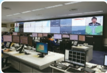
消防指令センター

市役所新庁舎整備（本庁舎及び分庁舎（仮称））の工事現場で工事の進捗状況等を確認したほか、消防活動の中心となる消防指令センター等を視察しました。