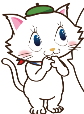
京都市会マスコットキャラクター マタリーヌ

9月市会では、安心・安全なまちづくり等のための補正予算の議論を行ったほか、市民の皆様からお預かりした大切な税金がどのように使われたのかなど、しっかりと審議したのね。