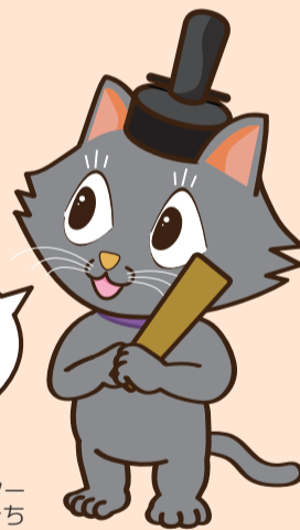
京都市会マスコットキャラクター またきち