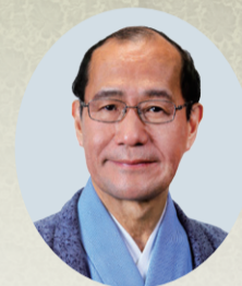
京都市長 門川 大作

市民の皆様には選ばれた議員の皆様による、新しい市会の発足を心からお慶び申し上げます。