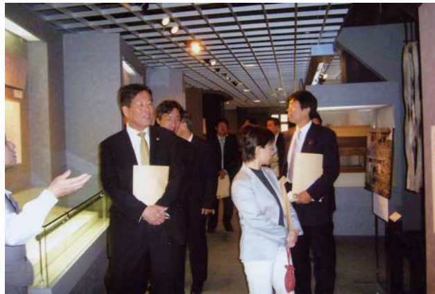
京都市学校歴史博物館