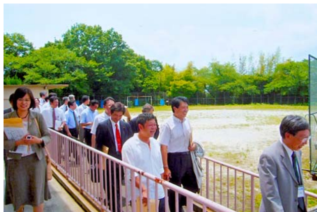
京都市立桃陽総合支援学校