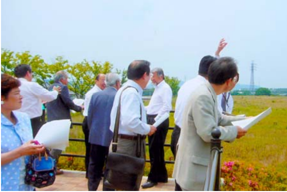
水垂埋立処分地跡地