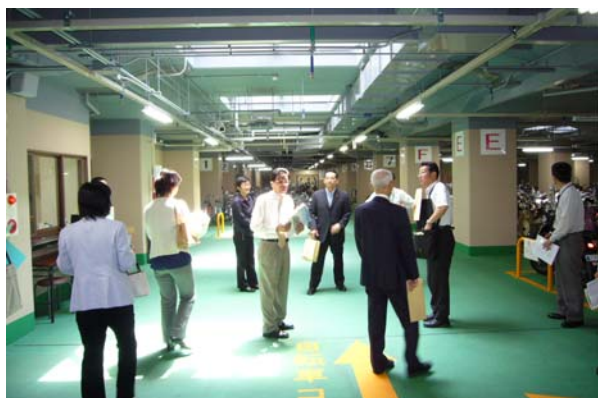
太秦天神川駅自転車等駐車場