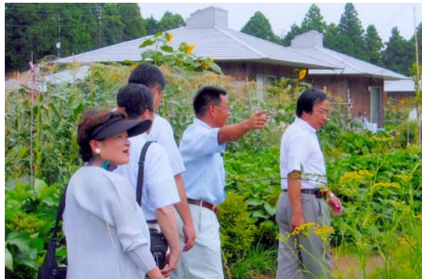
クラインガルテン栗源