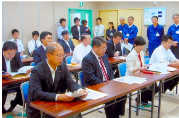
魚アラリサイクルセンター