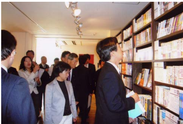
京都国際マンガミュージアム