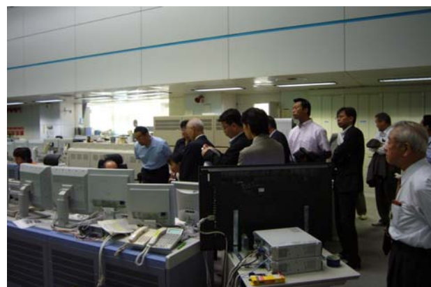
横浜市消防司令センター