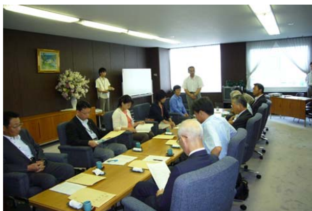
札幌市議会会議室