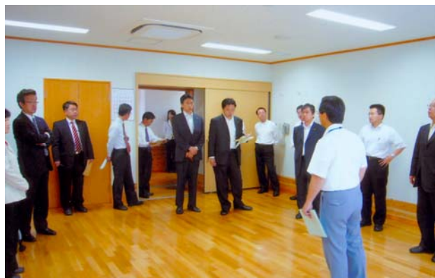
崇仁コミュニティセンター