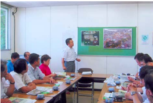
神明台埋立処分地管理事務所