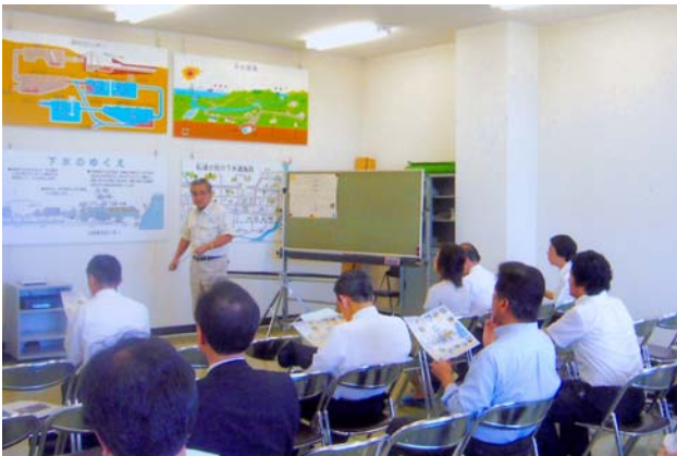
江別浄化センター