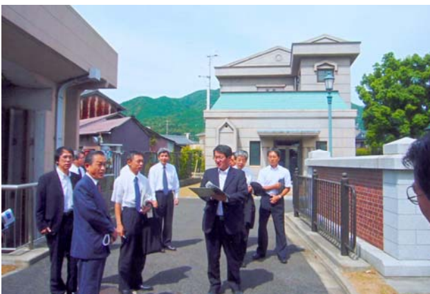
琵琶湖疏水第2疏水取水口