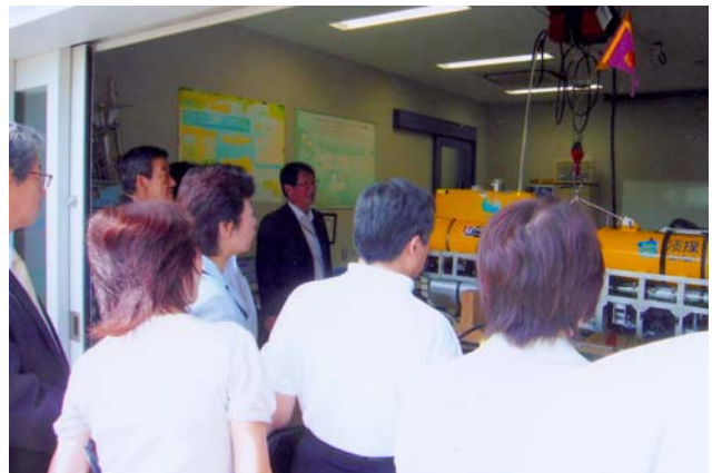
滋賀県琵琶湖環境科学研究センター