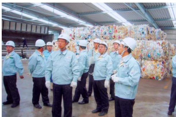
新日本製鐵株式会社大分製鐵所（大分市）