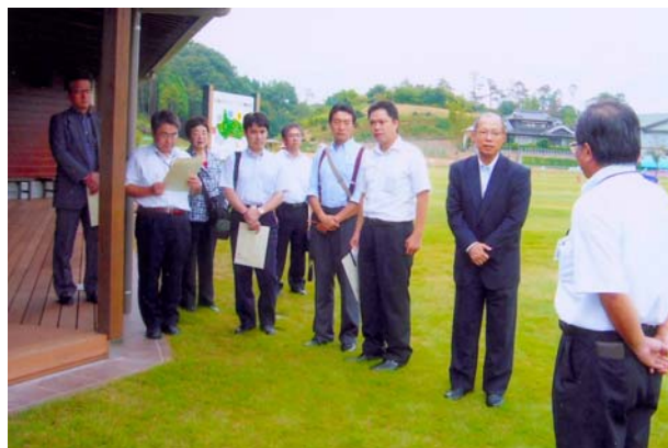
福山市グラウンド・ゴルフ場