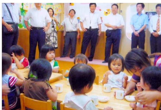
Jキッズルミネ北千住保育園（東京都）