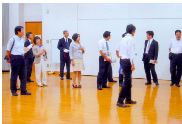
長野市生涯学習センター