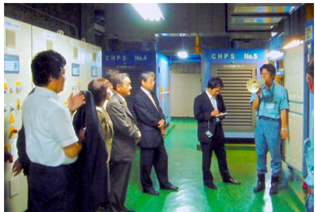
苫小牧市西町下水処理センター