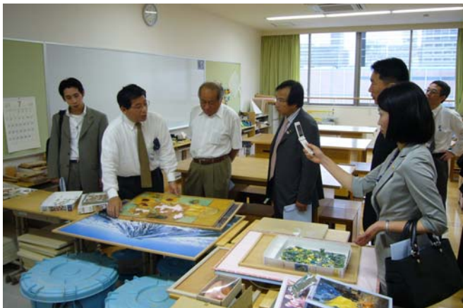
こども相談センターパトナ