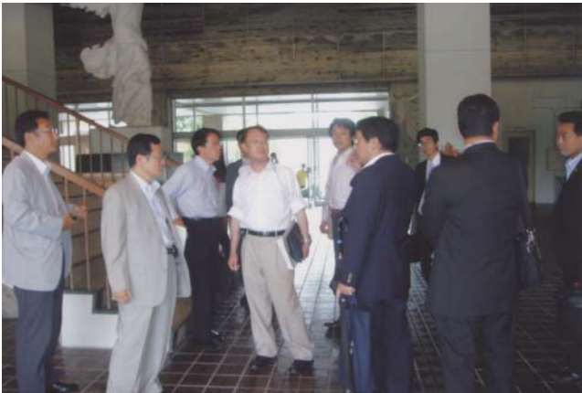
金沢美術工芸大学