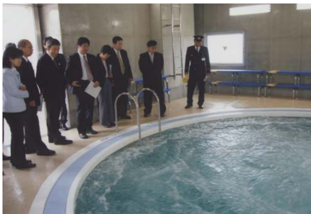
消防活動総合センター