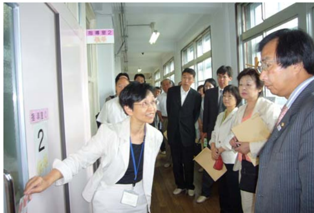
発達障害者支援センター「かがやき」