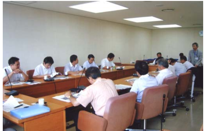
函館市議会会議室