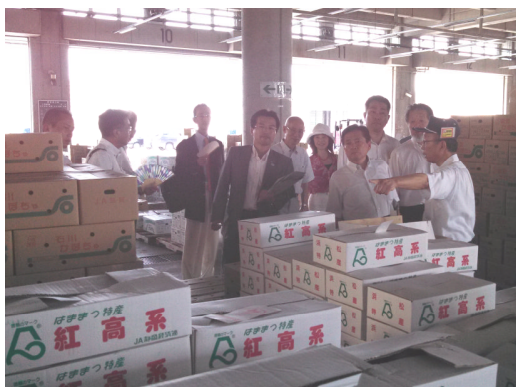
中央卸売市場（金沢市）