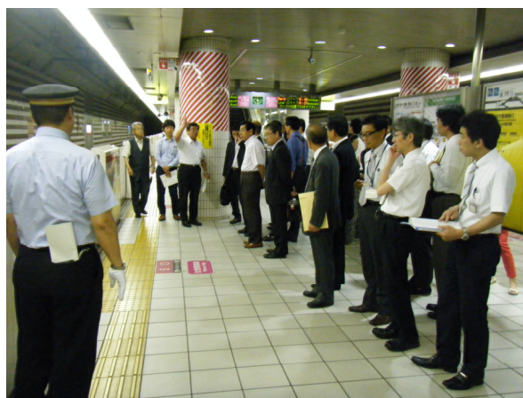
J R 北新地駅