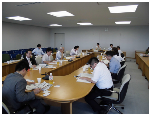
新潟市役所会議室