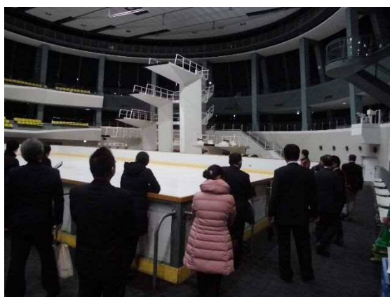
京都アクアアリーナ