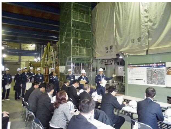
新川6号幹線工事現場