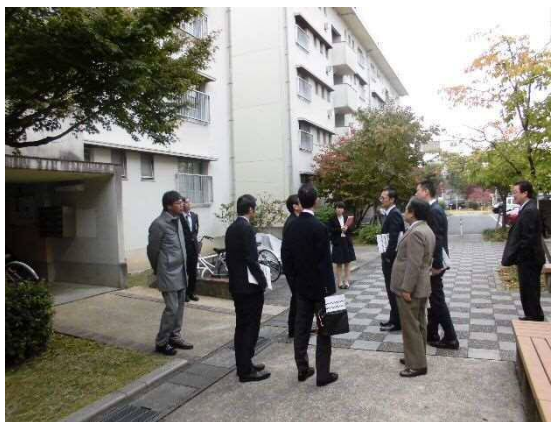
UR都市機構桃山南団地