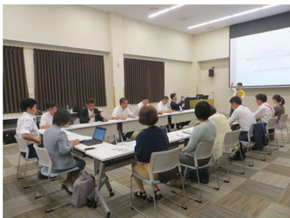
柏地域医療センター会議室