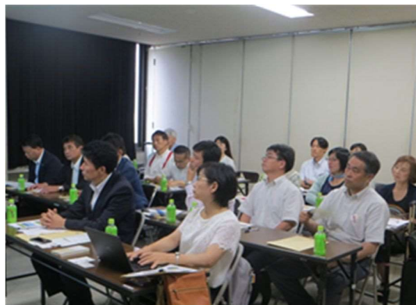
NPO法人さいたまユースサポートネット会議室