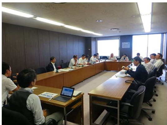
札幌市役所会議室