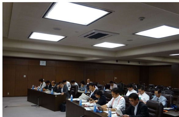
仙台市議会会議室