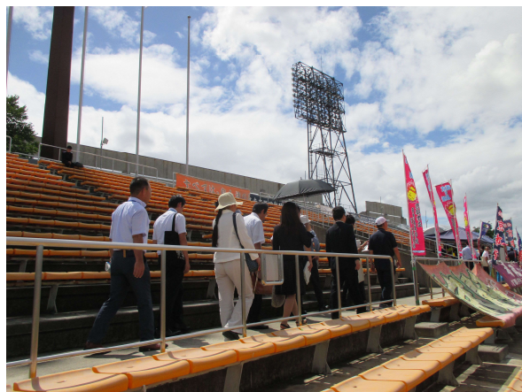
西京極総合運動公園陸上競技場兼球技場