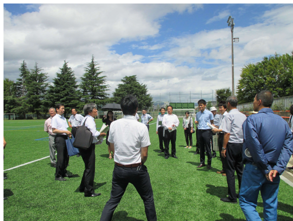
吉祥院公園球技場