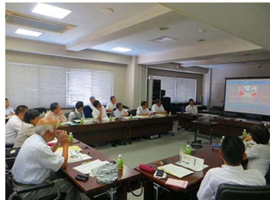
川崎市役所会議室