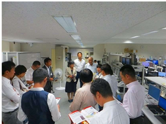
東京消防庁指令室