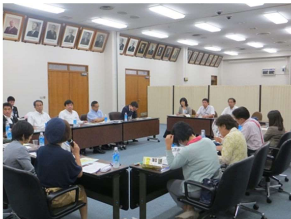
横浜市役所会議室