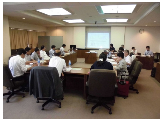
神戸市役所会議室