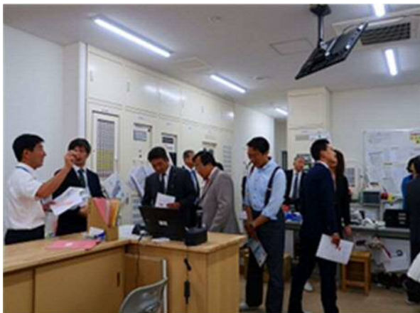
京都市立向島秀蓮小中学校