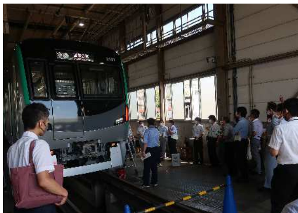
地下鉄烏丸線竹田車両基地