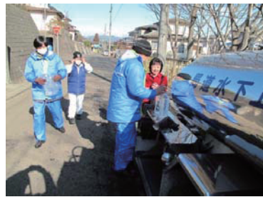
東日本大震災時の給水活動の様子

東日本大震災の発生を機に、災害時のライフラインの機能喪失が与える影響の大きさが再認識されています。また、近年の集中豪雨による都市型水害への対応も急がなければなりません。安全・安心な市民生活を守るため、地震や水害に備えた災害対策を進めていく必要があります。