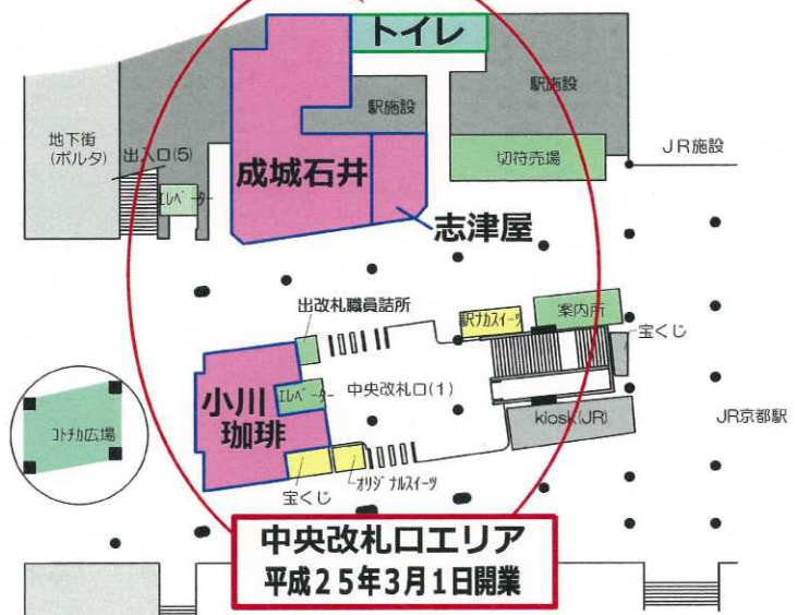
コトチカ京都完成図