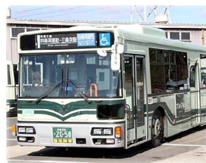
新たに登場する 「四条河原町ショッピングライナー」