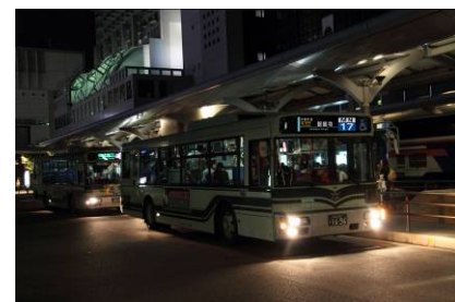
新たに登場する「MN17号系統」