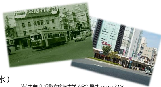
(左)大島明 撮影立命館大学 ARC 提供 osma213 (右)株式会社写真化学 提供

ウ 各ラリーポイントに設置されている、スタンプラリーのポスターを、デジタルスタンプラリーのARカメラで読み込み、アプリ内でスタンプを集めてください。