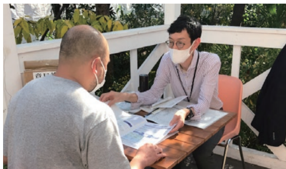
市民の皆様との意見交換