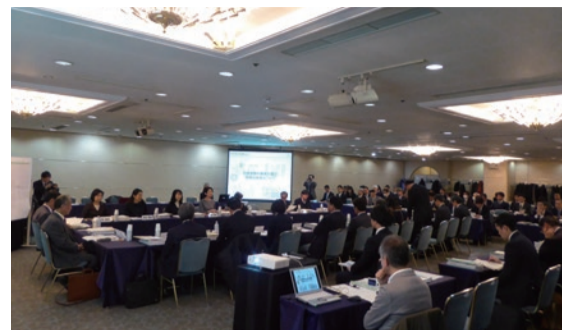
基本計画審議会での丹念な議論