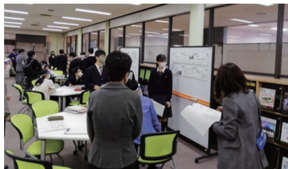
高校生との意見交換