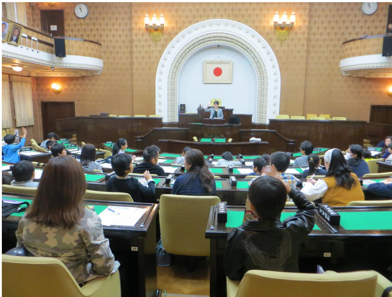
京都市会 親子ふれあい議場見学会（平成29年11月3日）