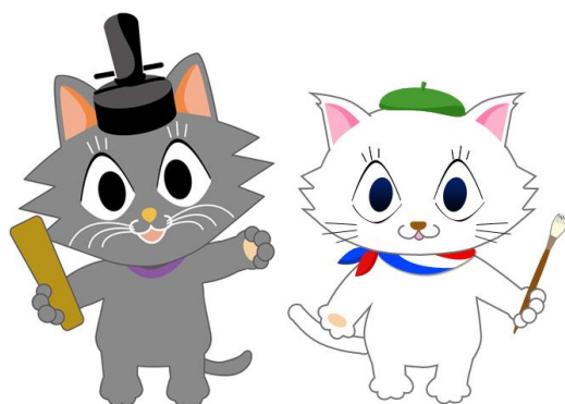
* またきち *