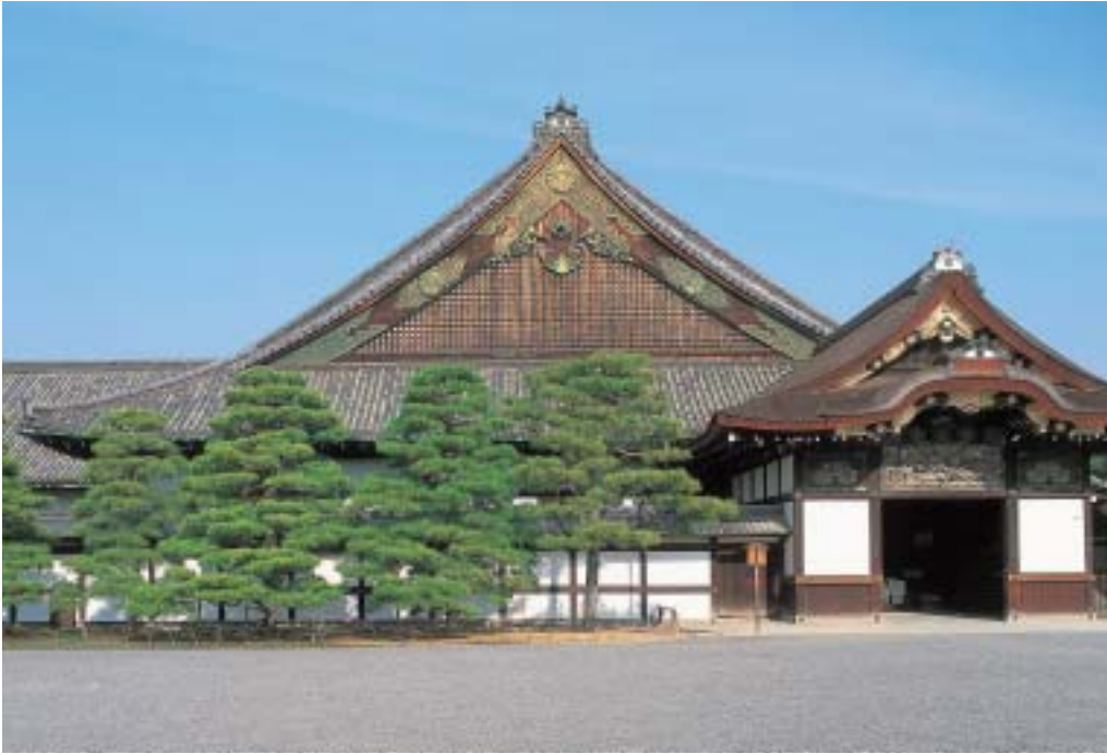
二条城 二の丸御殿(築城400年)