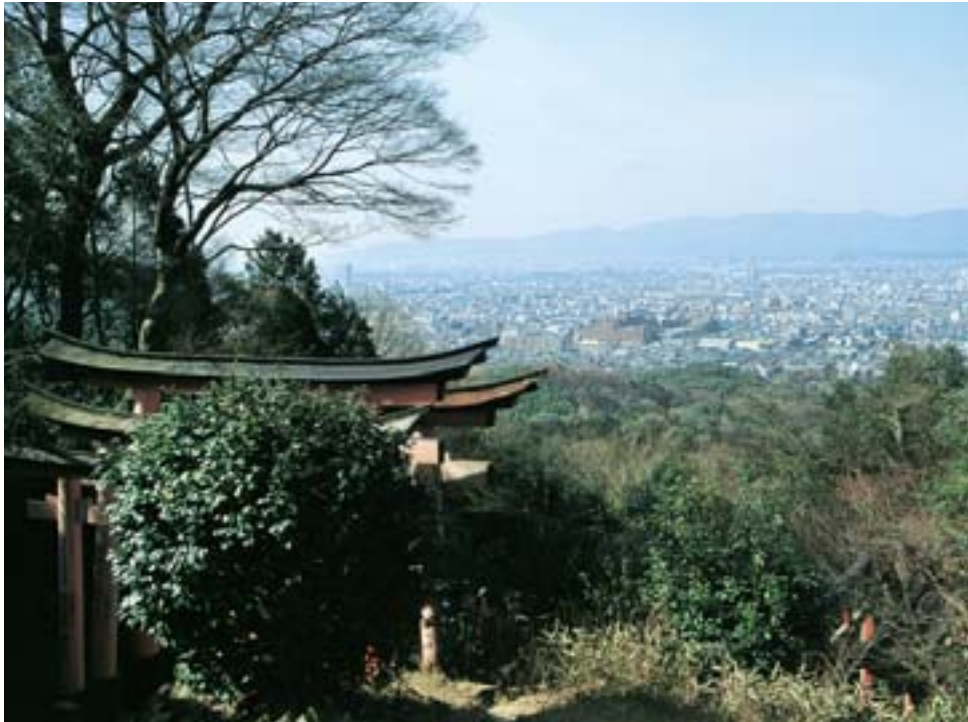
稲荷山からの眺め