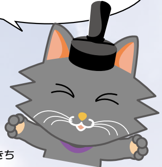
またきち (市会マスコットキャラクター)