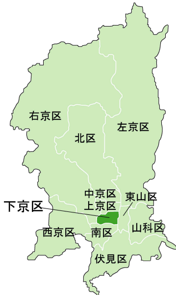
図 - 2 下京区の位置