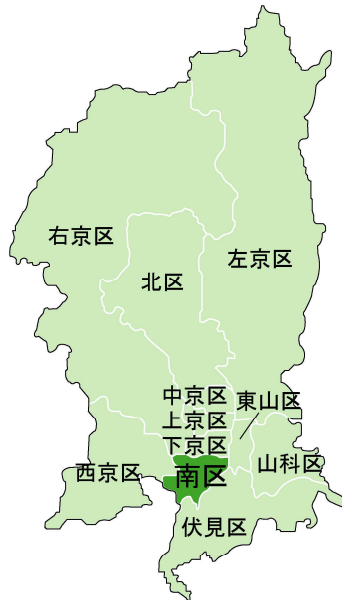
図 3 南区の位置