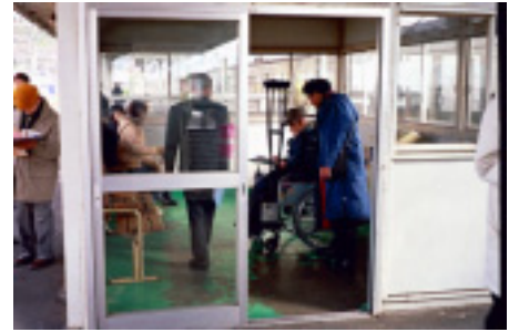
駅ホーム調査風景