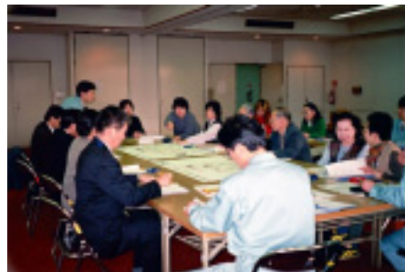
問題点抽出の様子