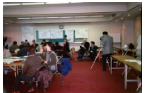
問題点発表の様子