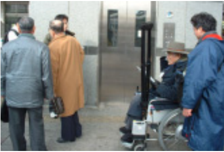
駅前広場調査風景