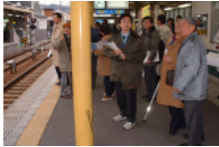
駅ホーム調査風景