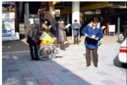
駅前広場調査風景