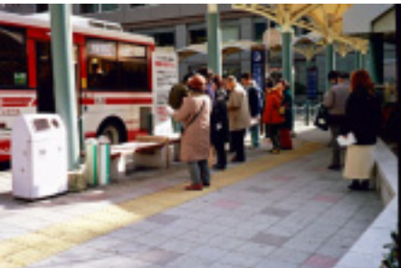
駅前広場調査風景