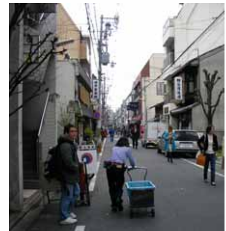
【参考】御幸町三条にある ヤマト運輸サテライトセンター