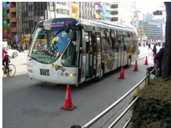
東京・メトロリンク日本橋