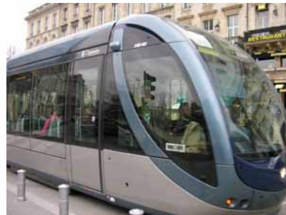
ボルドー(フランス)