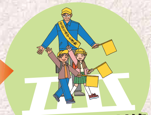
通学路の安全対策