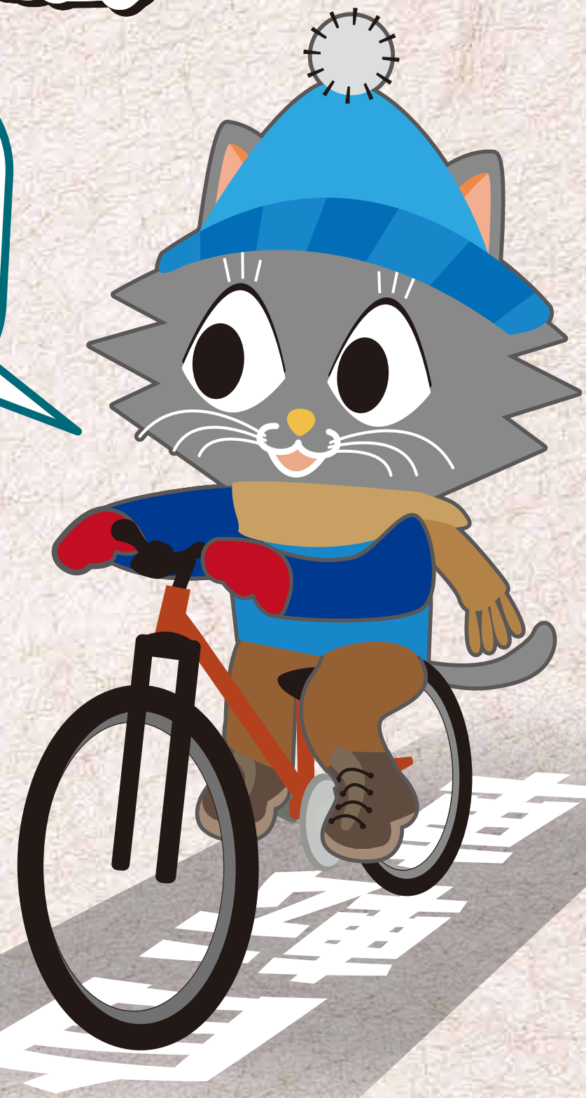
またきち(市会マスコットキャラクター)