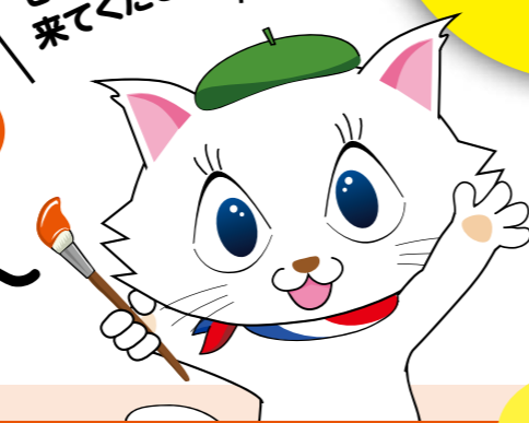
京都市会マスコットキャラクター マタリーヌ