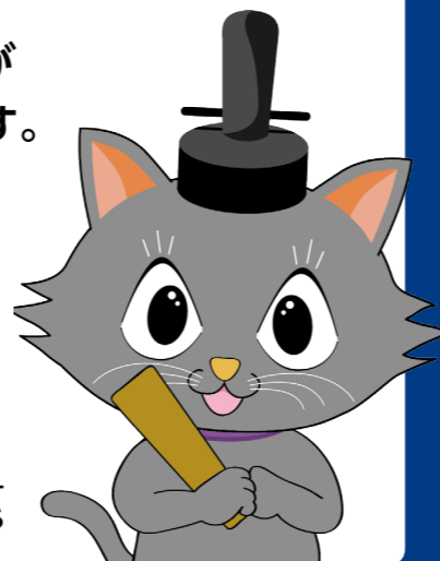
京都市会マスコットキャラクター またきち

これからも、市民の皆様の代表として、よりよい京都市にむけて取り組んでまいります。