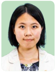
森 かれん 上京区(京都)

子ども医療費の通院上限額を引き下げたが申請手続きが必要。政策効果をどう捉えるか。