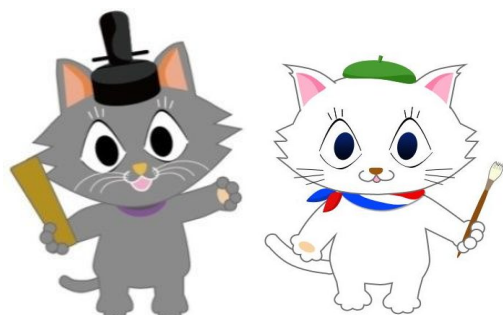
京都市会マスコットキャラクター またきち マタリーヌ